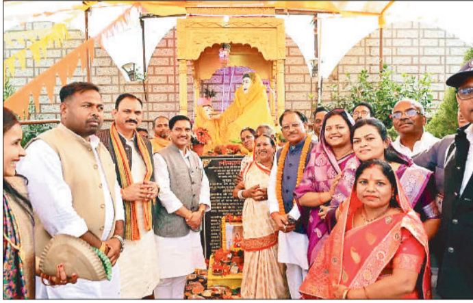
कार्यक्रम में उपस्थित मुख्यमंत्री व अन्य जनप्रतिनिधि।

कार्यक्रम में शामिल होने पहुंचे सीएम श्री साय ने कहा कि साहू समाज एक अत्यंत गौरवशाली समाज है। भक्त माता कर्मा, माता राजिम दाई व दानवीर भामाशाह जैसी महान विभूतियां इसी समाज की देन हैं। सीएम श्री साय ने कहा कि छत्तीसगढ़ के विकास में सबसे बड़ी बाधा नक्सलवाद था। केरल से भी बड़े भू-भाग वाला बस्तर क्षेत्र 40 वर्षों से अधिक समय तक नक्सल हिंसा से ग्रस्त रहा, जहां न सड़क थी, न बिजली, न पानी।